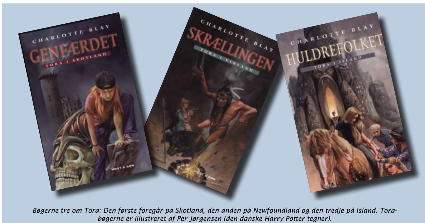
Bøgerne tre om Tora: Den første foregår på Skotland, den anden på Newfoundland og den tredje på Island. Tora-bøgerne er illustreret af Per Jørgensen (den danske Harry Potter tegner).

Skrællingen kan ikke få fred, før nogen har løskøbt ham fra vikingernes fangenskab. Det betyder, at Tora må